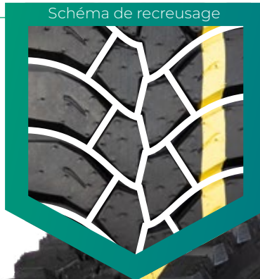
Schéma de recrusage